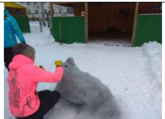
Поделки детей и их родителей на конкурс «Новогодняя игрушка 2018»