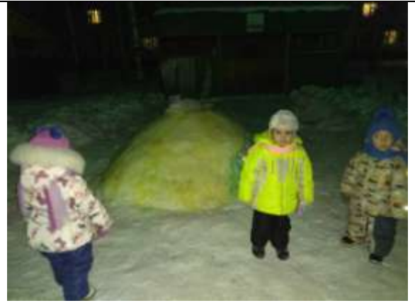
Постройки на участке