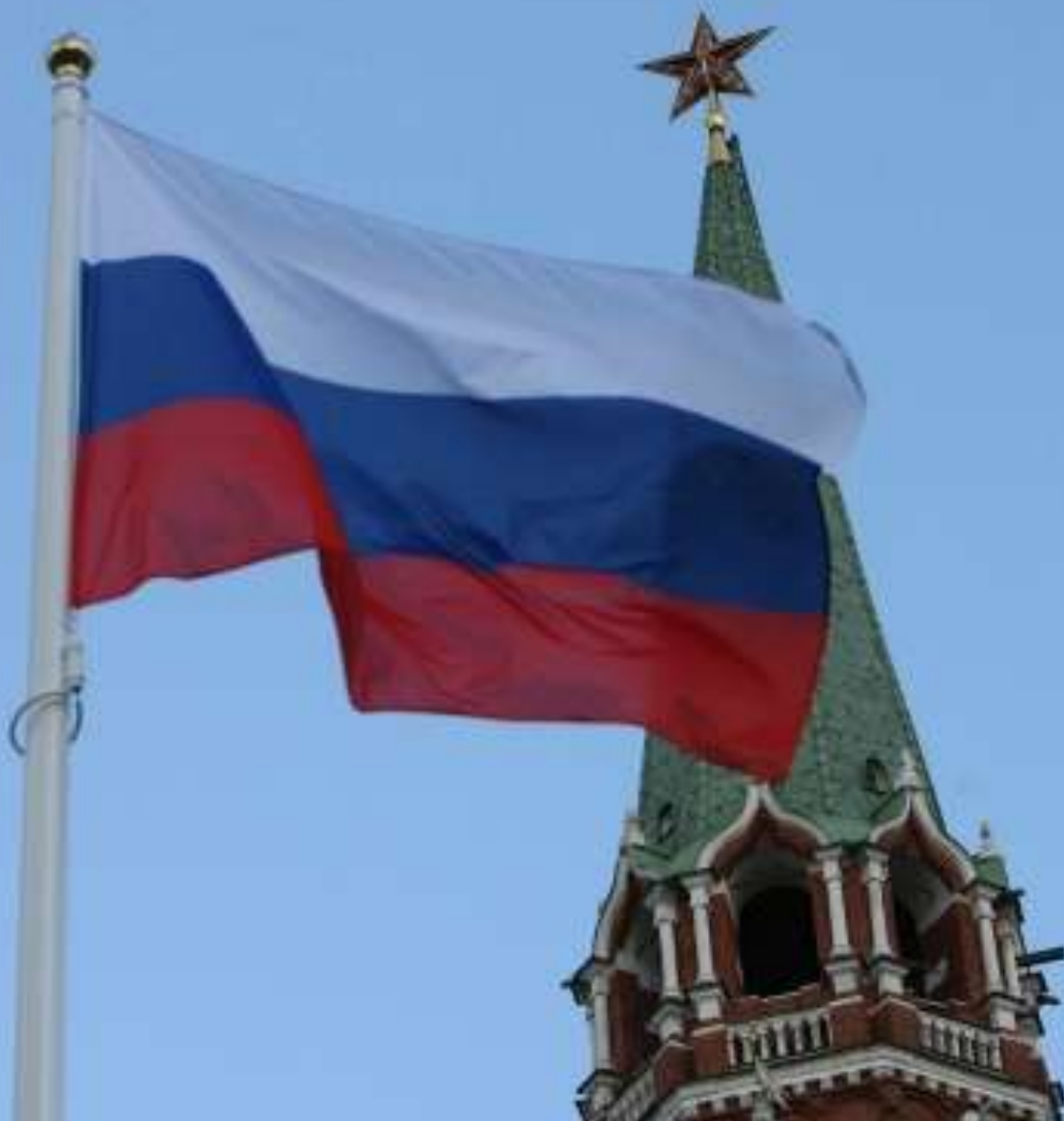
Флаг России над Кремлём.